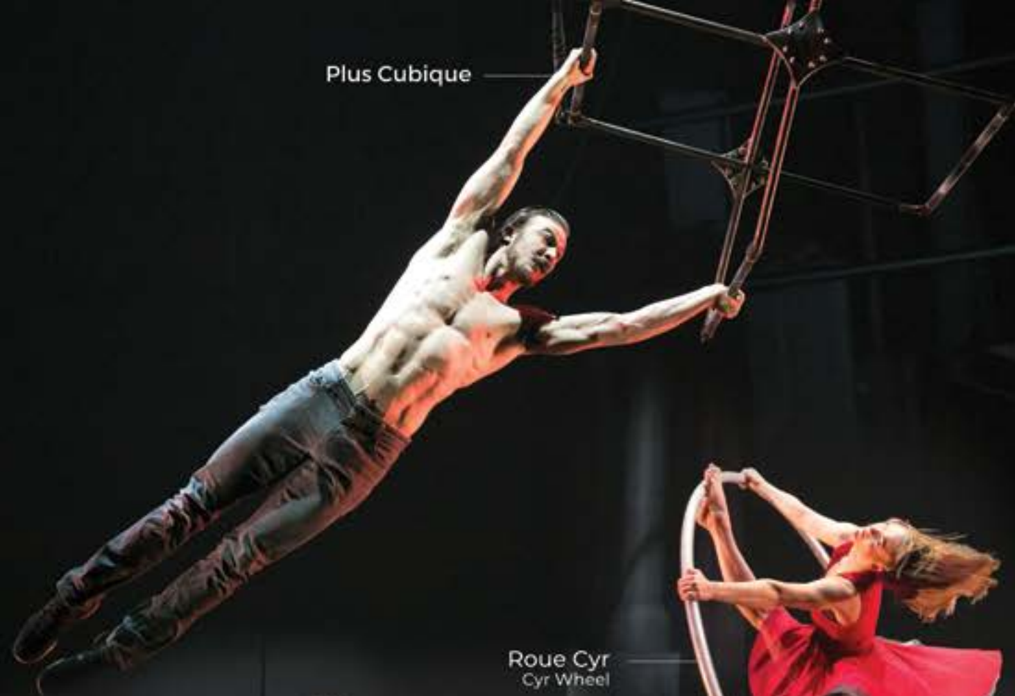
Roue Cyr Cyr Wheel