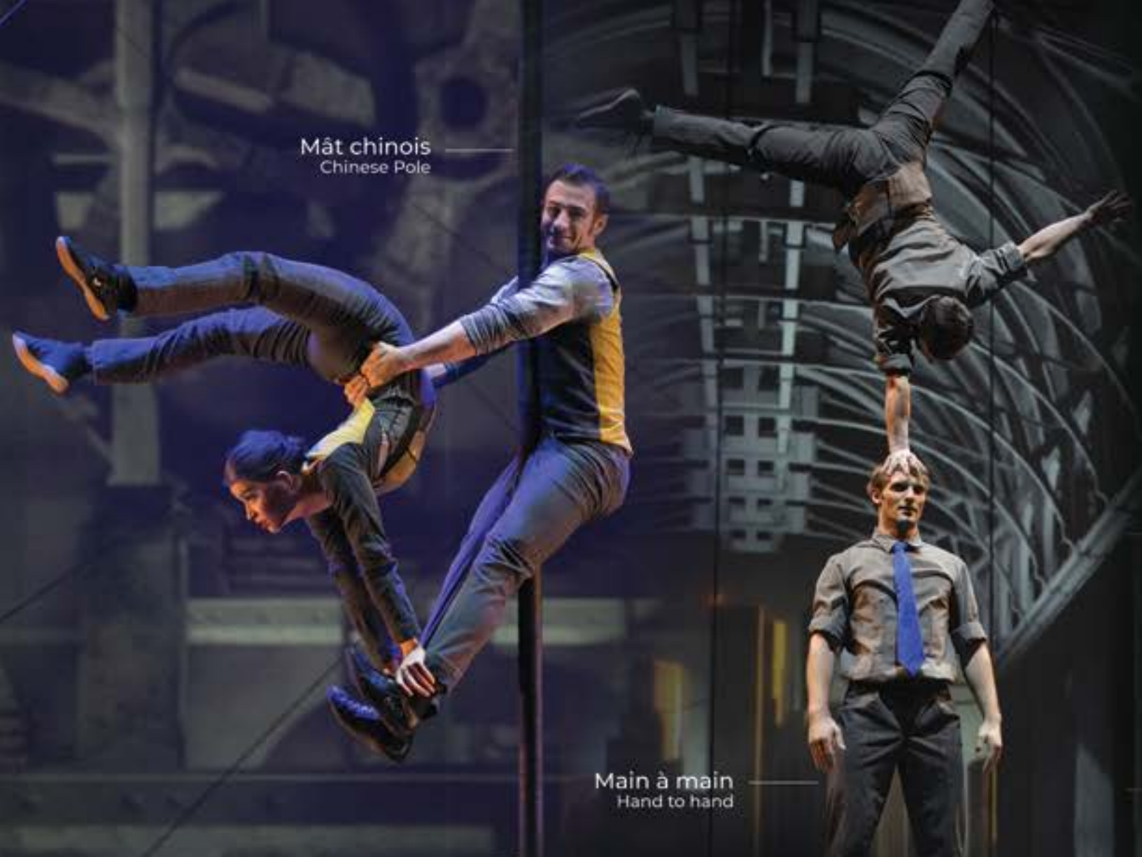
Main à main Hand to hand