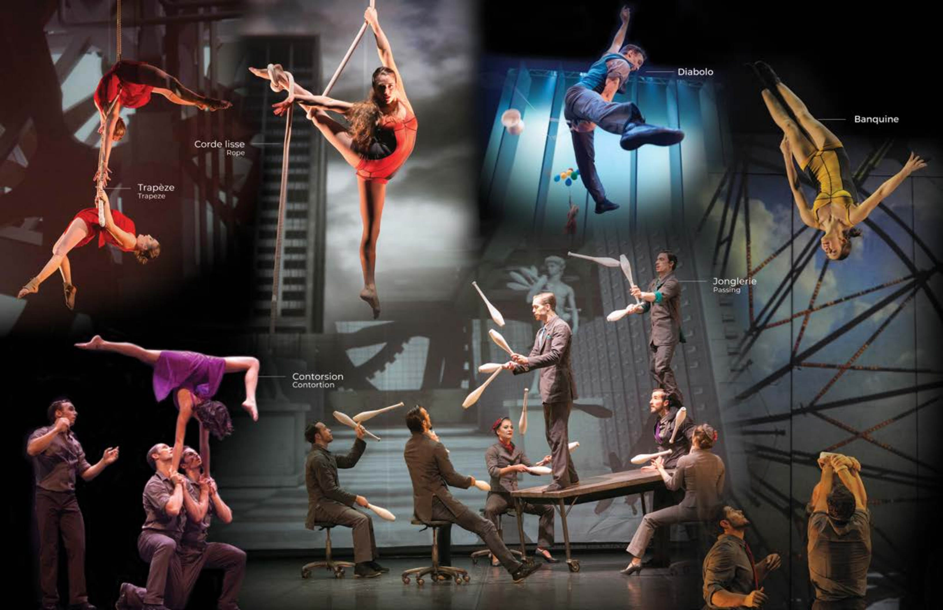
Corde lisse Rope